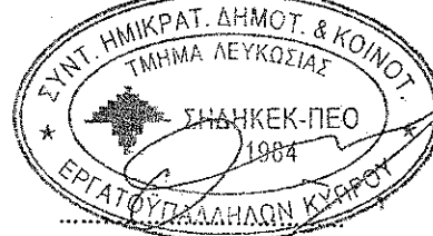
Αδάμος Ανδρέου Επαρχιακός Γραμματέας ΣΗΔΗΚΕΚ- ΠΕΟ